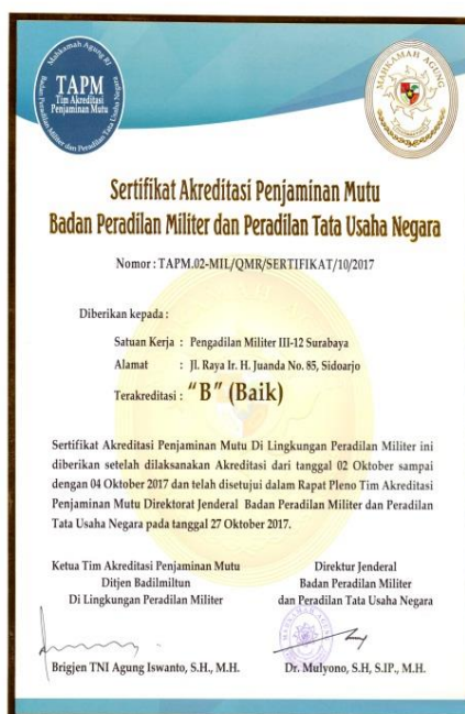
Gambar II.2 Sertifikat Akreditasi Penjaminan Mutu

Sejalan dengan koitmen untuk memberikan pelayanan publik yang berkualitas, Pengadlan Militer III-12 Surabaya rutin melaksanakan survei kepuasan masyarakat terhadap kinerja dan pelayanan yang