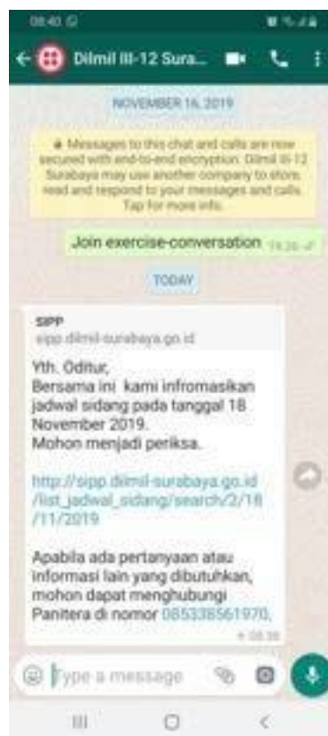
Gambar 3.4 Tampilan pesan yang diterima melalui media WA