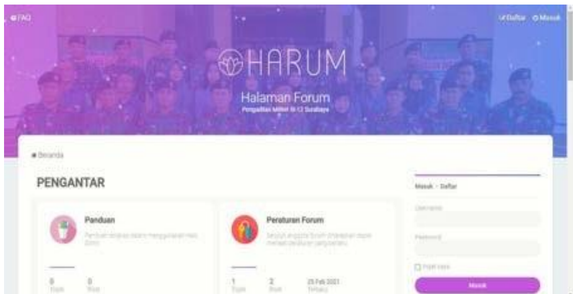
Gambar 2.2 Tampilan Halaman Depan Aplikasi HARUM

Aplikasi HARUM menyediakan layanan diskusi dan berbagi informasi dari masyarakat maupun dari Pengadilan Militer III-12 Surabaya. Aplikasi HARUM dijalankan dengan menunjuk Hakim sebagai pengampu atau narasumber.