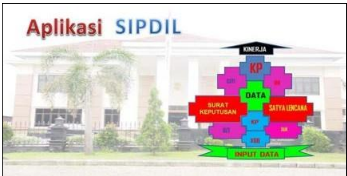
Gambar 3.16 Halaman Depan Aplikasi SIPDIL

Aplikasi SIPDIL berfungsi untuk mengolah data kepegawaian. Dengan melakukan sekali input data kepegawaian secara lengkap di halaman data, maka akan diperoleh langsung beberapa dokumen kepegawaian seperti data Kenaikan Gaji Berkala (KGB), data Daftar Urut Kepangkatan (DUK), data kenaikan Pangkat dan data kepegawaian lain sesuai fitur yang tersedia di aplikasi SIPDIL.