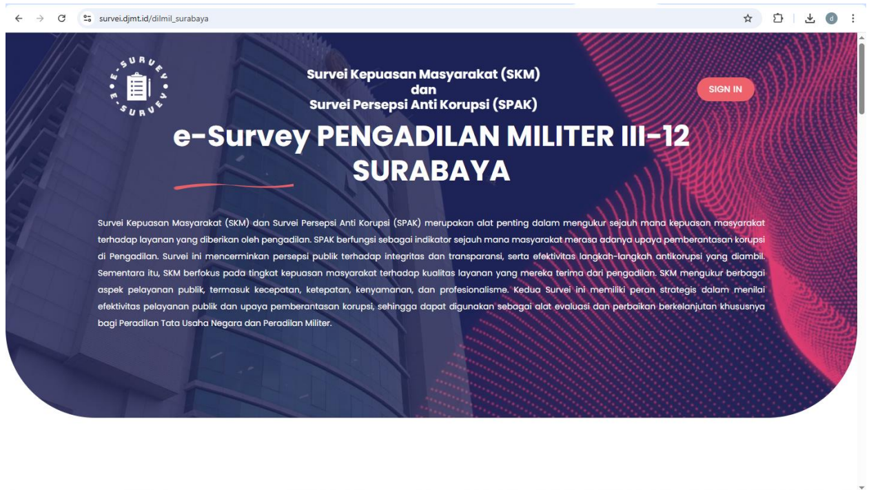
Gambar 1. Contoh Halaman Dalam Aplikasi E-survey

Variabel pada pengukuran ini didasarkan pada Peraturan Menteri Pendayagunaan Aparatur Negara dan Reformasi Birokrasi Nomor 14 Tahun 2017 tentang Pedoman Penyusunan Survei Kepuasan Masyarakat Unit Penyelenggara Pelayanan Publik yang terdiri dari 9 unsur, antara lain: